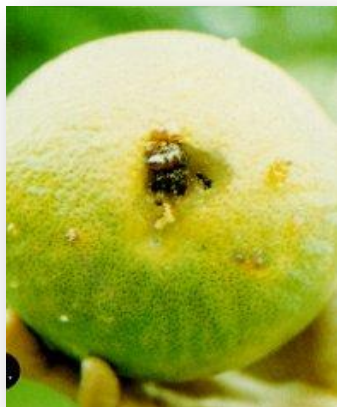
ผลที่ไม่ถูกทำลาย ผลที่ถูกทำลาย